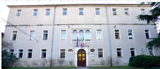
Capodistria sede centrale