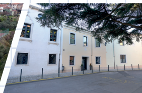
Capodistria sede dislocata